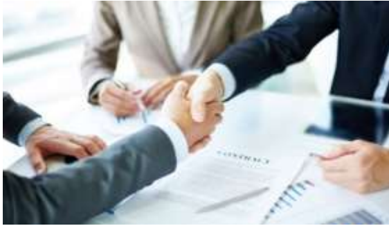
Métiers du Commerce et de la Vente option B : Prospection Clientèle et Valorisation de l'Offre Commerciale