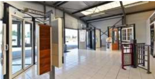
Ouvrages du Bâtiment : Métallerie/ Menuiserie Alu Verre