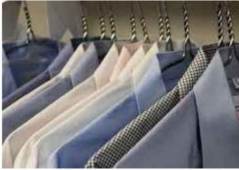
Métiers de l'Entretien des Textiles option B : Pressing