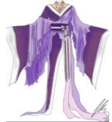
Métiers de la mode :