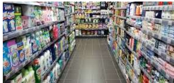
Métiers du Commerce et de la Vente option A : Animation et Gestion de l'espace Commercial