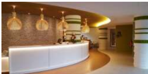
Métiers de l'Accueil